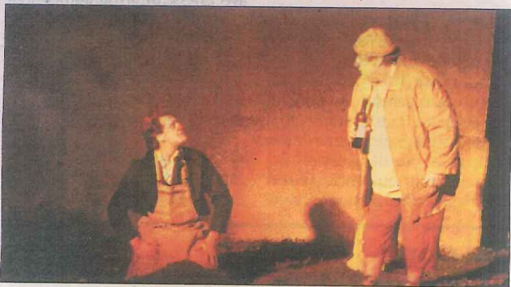
La compagnie Scènes en chantier a présenté un spectacle de qualité.

Vendredi, la soirée sous les étoiles était idéale pour attirer un public nombreux. Seulement une soixantaine de personnes a profité d'une température agréable, et surtout d'un spectacle original, drôle et profond à la fois : « La Pelle de la terre », de la compagnie Scènes en chantier, de Barret. Avec le partenariat du Conseil général, c'est la commune, par le biais du Claps, centre de loisirs, activités physiques et sportives, qui a organisé cette soirée culturelle, après un repas rustique sur la place de l'église de Boutiers.